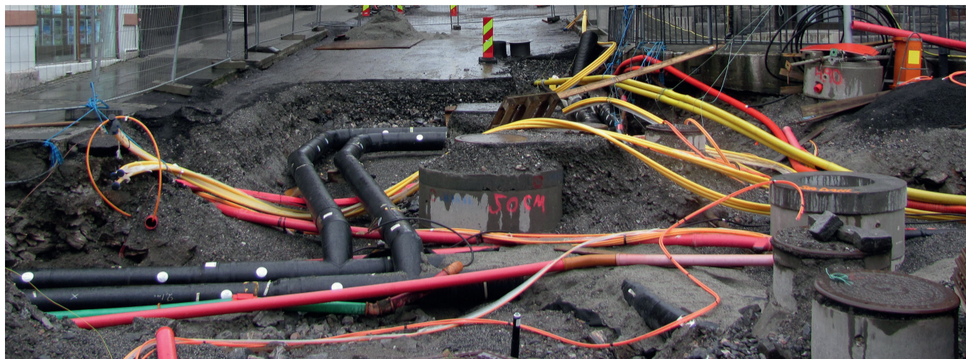
Het daadwerkelijk lokaliseren van kabels en leidingen door de aannemer is een keiharde resultaatsverplichting.